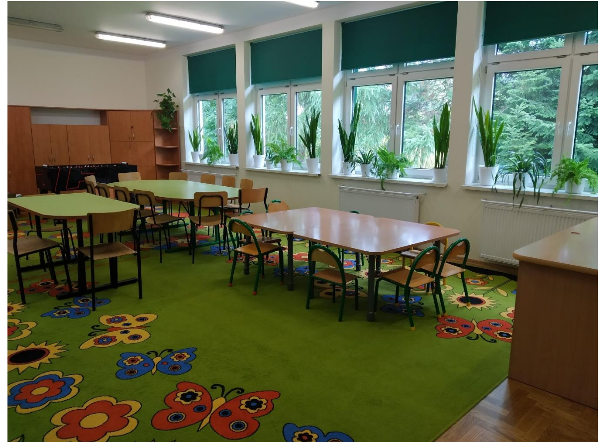
Remont i doposażenie świetlicy w budynku 713