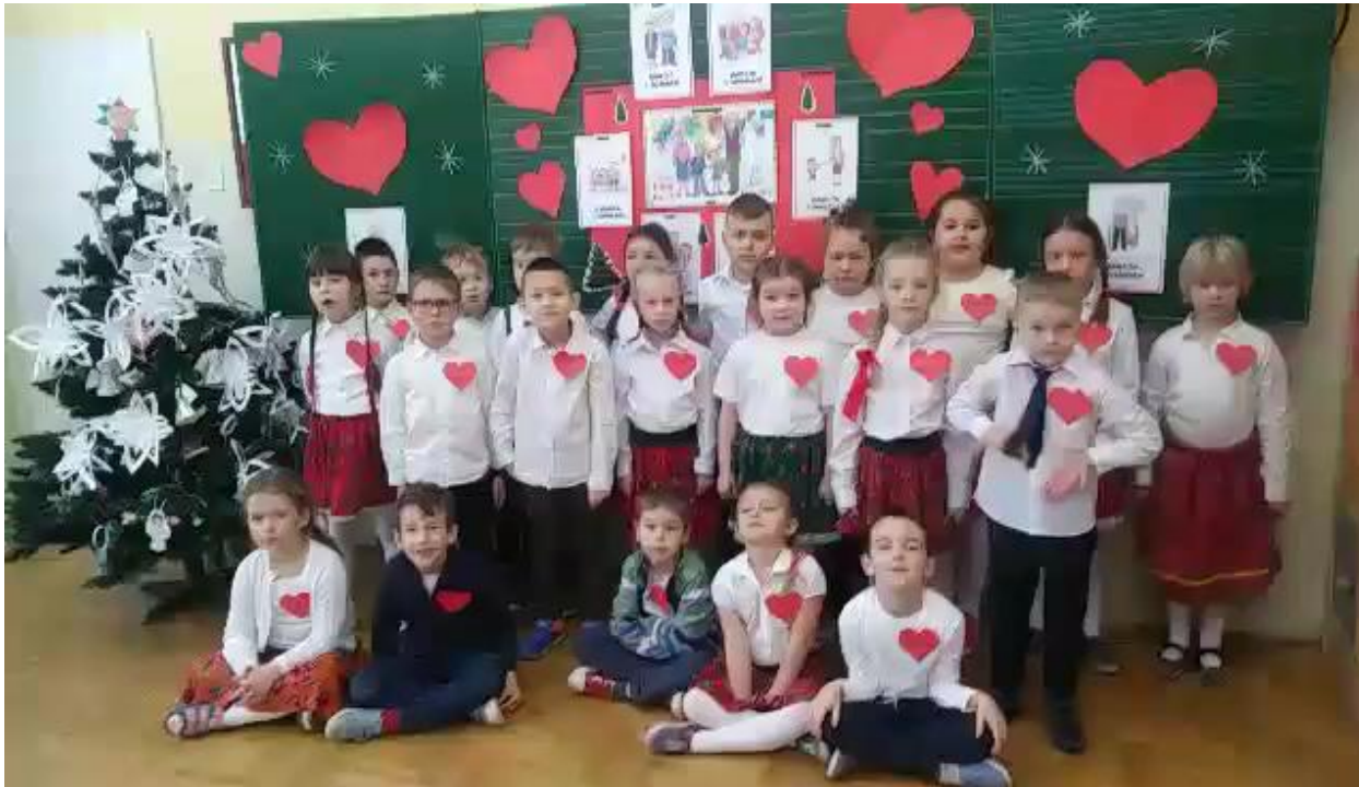
Dzień babci i dziadka