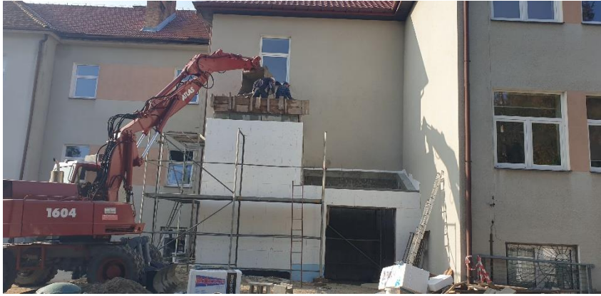
Budowa windy dla osób niepełnosprawnych