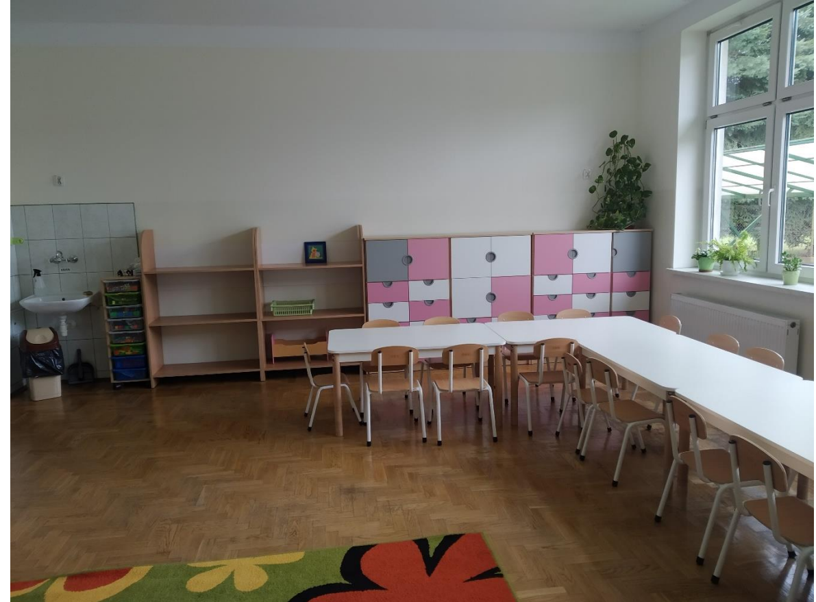
Remont i doposażenie sali dla oddziału przedszkolnego w budynku 713