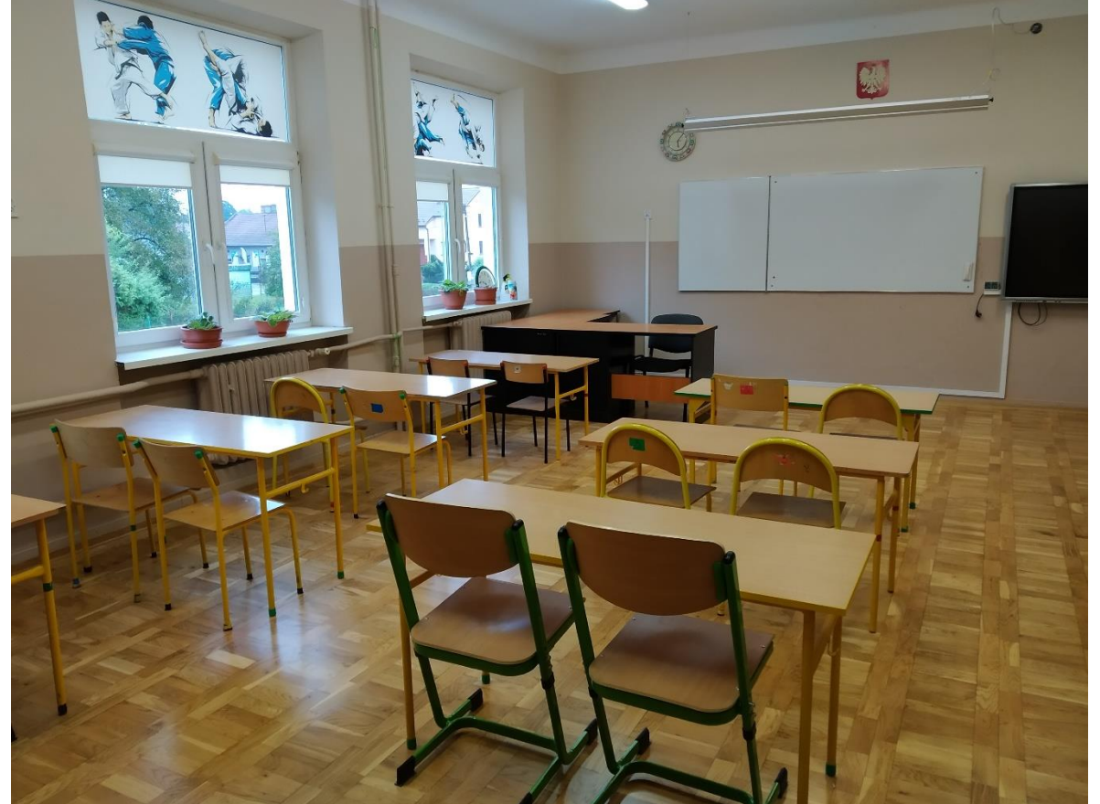
Cyklinowanie parkietu w budynku 97 i 713