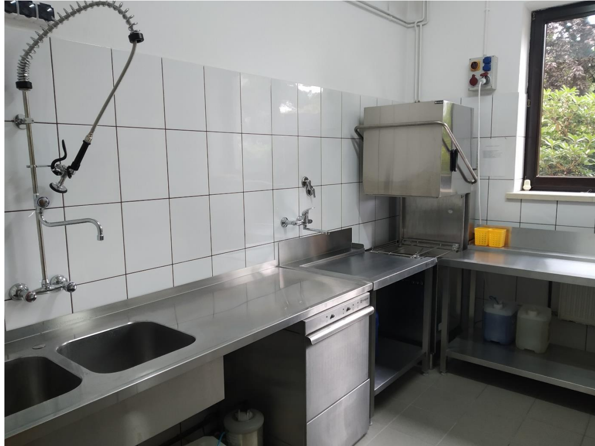
Doposażenie kuchni w budynku przedszkola o ciąg zmywalni naczyń